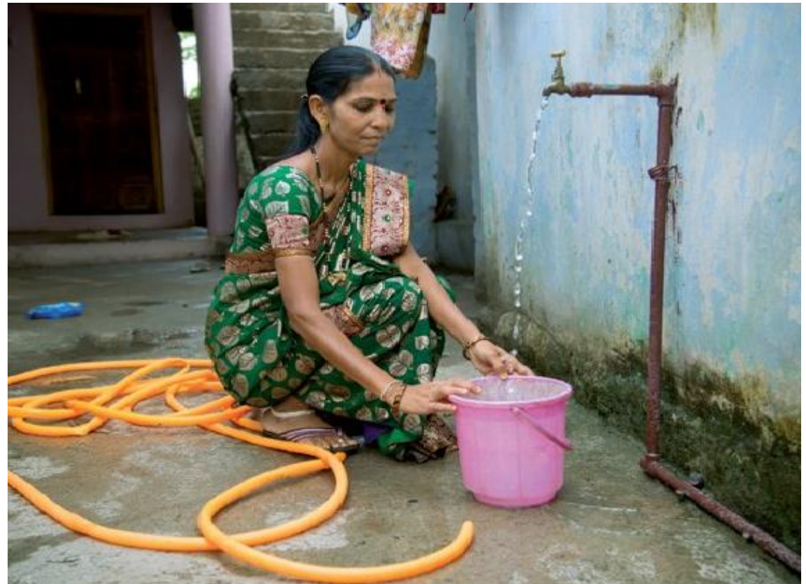
Pompe à eau solaire Pour l'arrosage